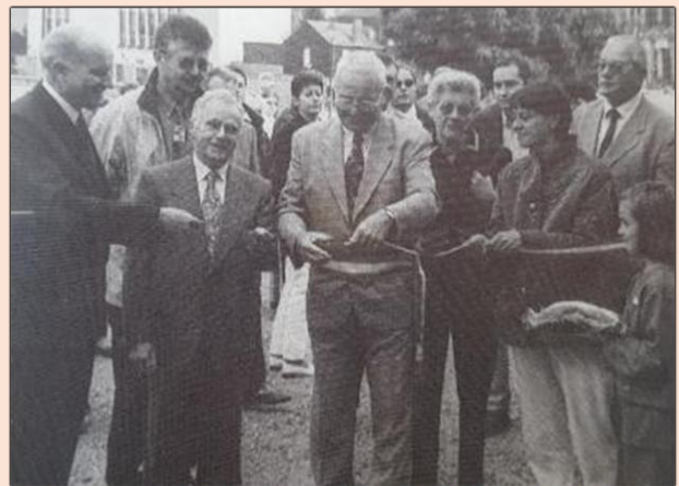
Cliché de l'inauguration du centre socio-culturel en 1998

On y retrouve alors à l'étage une bibliothèque où de nombreuses manifestations culturelles sont organisées. Le rez-de-chaussée quant à lui accueille dès 2001 le siège de l'intercommunalité des Balcons de Meuse.