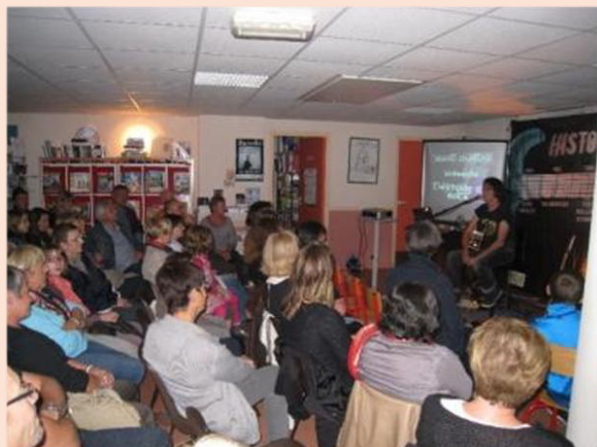
Conférence sur l'histoire du Rock 20 sept. 2013

La première animation publique de la bibliothèque s'articule autour de Guy Golette, auteur et poète ardennais. D'autres manifestations sont organisées dans les années suivantes et abordent des sujets variés. On peut par exemple citer la conférence autour du chemin de fer en 2007 ou celle sur l'histoire du rock en 2013. Des soirées littéraires sont également organisées. L'année 2021 a par exemple été marquée par les venus de Jean d'Albis et de Sabyl Goussoub, prix Goncourt lycéens.