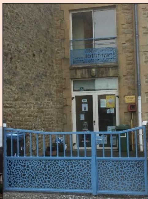
Photographies de la bibliothèque