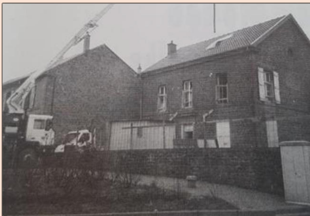
Photographie des travaux en 1997

La situation de cet édifice n'évolue plus jusqu'en 1996 où la commune envisage le déménagement du bureau de poste. Celui-ci doit être installé au niveau de la mairie pour permettre la création du centre socio-culturel. Ainsi les travaux débutent en 1997 et l'inauguration a lieu l'année suivante.